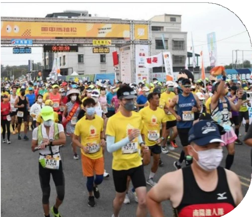
台灣米倉田中馬拉松